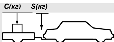
верное размещение груза