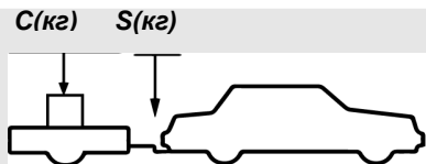
верное размещение груза